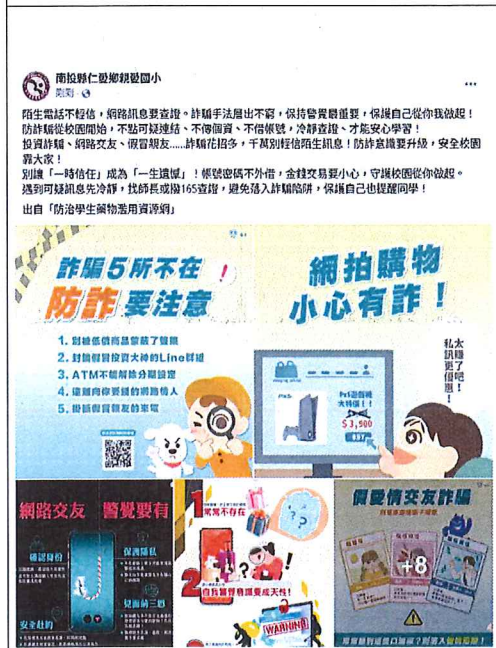
說明：學校臉書宣導常見的網路詐騙手法。