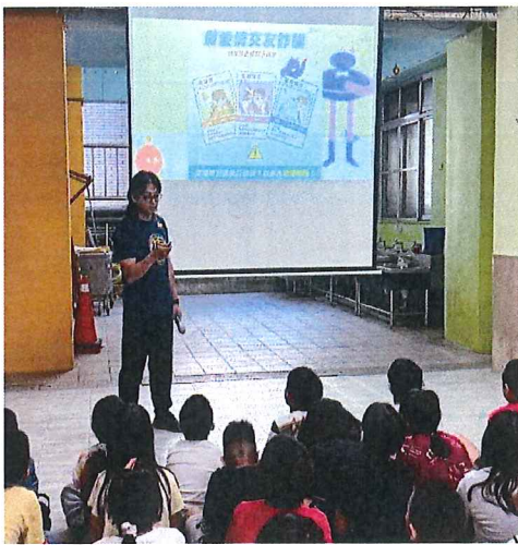
說明：假愛情交友詐騙手法宣導